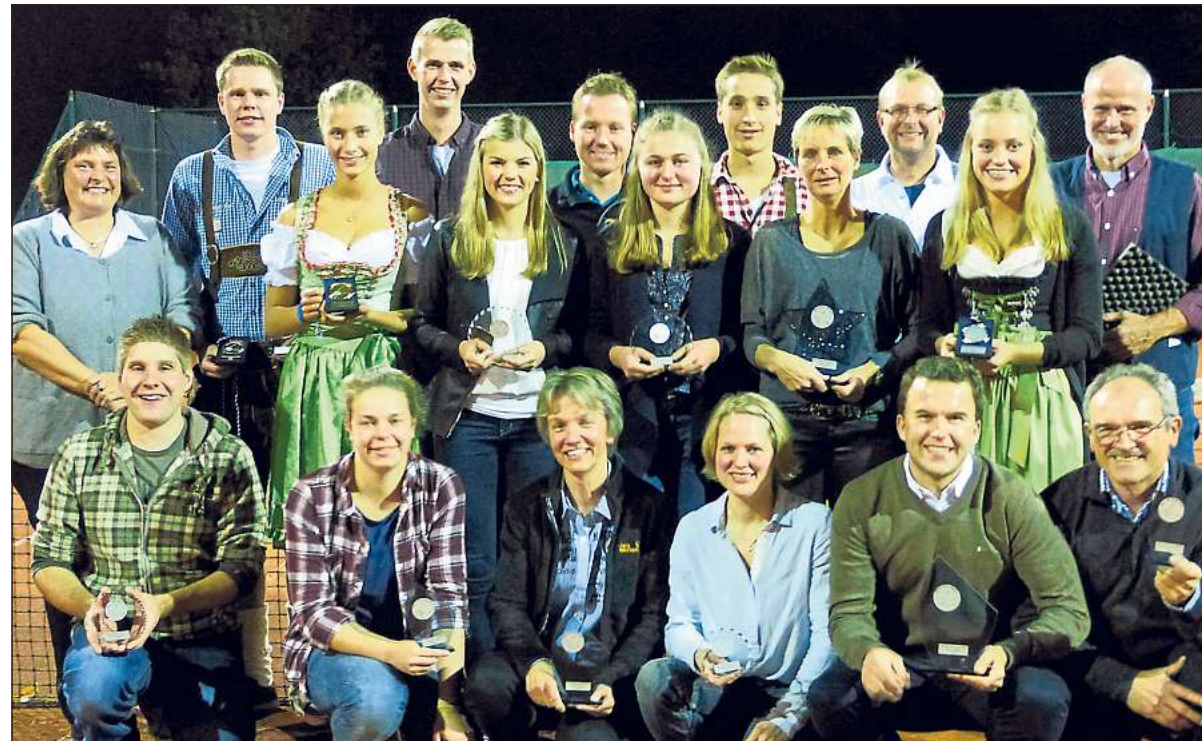
Nach der Siegerehrung, in der es zwischenzeitlich zu einigen Verwirrungen und vermeintlich falscher Pokalübergaben kam, die letztendlich jedoch alle gelöst wurden, konnten sich die Vereinsmitglieder noch auf einen entspannten Abend freuen. Das Bild zeigt die in dieser Saison erfolgreichen Tennisspieler aus Beelen.