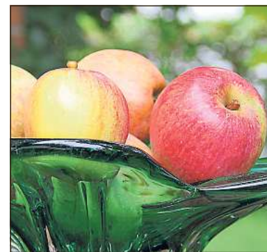
Äpfel aus der Region werden Freitag gereicht.

Themen des Abends werden unter anderem sein: Wie können die Bürger aktiv in der Gemeinde die Flüchtlingsarbeit unterstützen? Welche Aktionen der Beelener Grünen sind im Herbst / Winter geplant? Die Beelener Grünen freuen sich über eine rege Teilnahme.